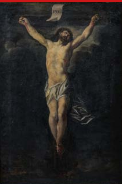
Italienischer Meister des 18. Jhs. Kreuzigung Jesu. Öl/Lw., gerahmt 66 x 46 cm