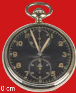
D=5,0 cm Dienstuhr fürs Reichsheer Deutschland/Schweiz um 1925 Stahl