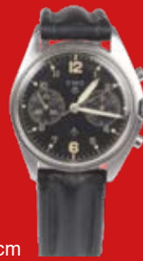
D=3,9 cm CWC, britische Militäruhr Schweiz um 1955, vernickelt