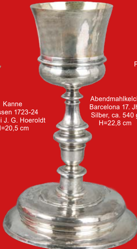
Abendmahlkelch Barcelona 17. Jh. Silber, ca. 540 g H=22,8 cm