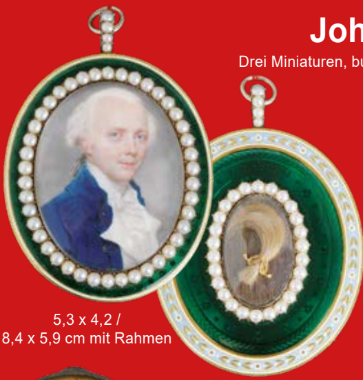
5,3 x 4,2 / 8,4 x 5,9 cm mit Rahmen

Drei Miniaturen, bunt gemalt in Puderfarben und aquarelliert auf Elfenbeinplatte