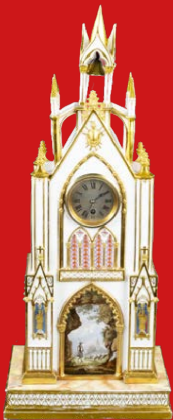
Bedeutende Prunktischuhr Paris, Dagoty et Honoré 1812-1820 H= 66,6 cm