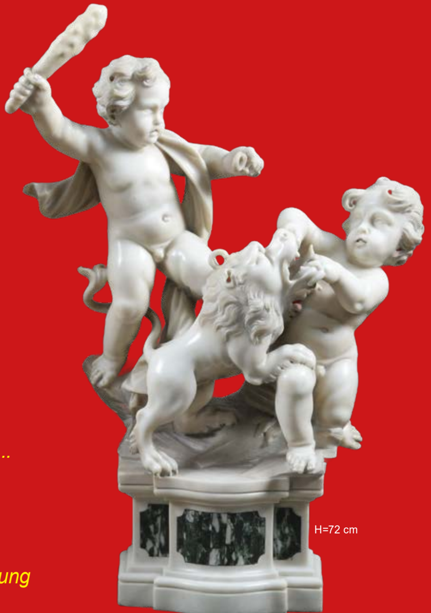
Paar Rokoko Puttengruppen Neapel, Meister Giuseppe Sanmartino (1720-1793) Marmor, poliert