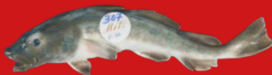
Royal Copenhagen um 1900, Entwurf Carl Liisberg L=25 cm