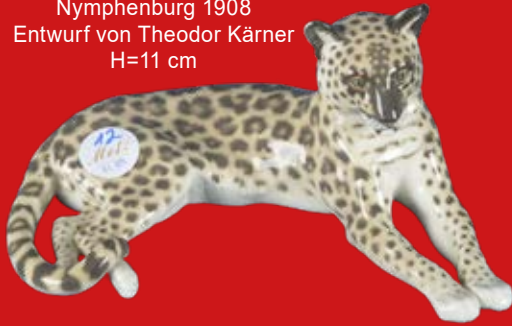
Nymphenburg 1908 Entwurf von Theodor Kärner H=11 cm