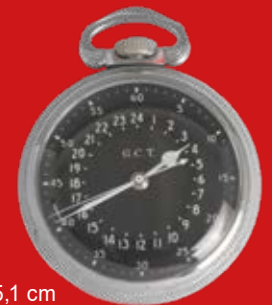
D=5,1 cm Navigationsuhr der U.S. Air Force, Hamilton Watch Co. USA um 1942, vernickelt