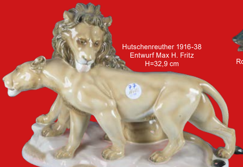
Hutschenreuther 1916-38 Entwurf Max H. Fritz H=32,9 cm

Eine leidenschaftliche, museale Porzellansammlung des 20. Jhs.