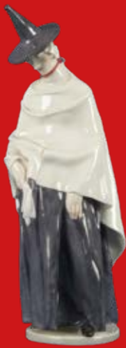
Nymphenburg Entw. R. Schröder-Lechner H=21 cm