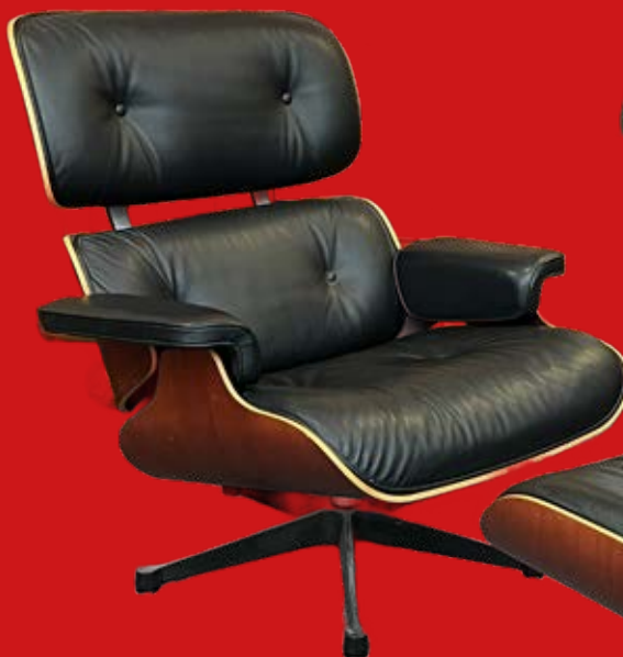
Vitra Lounge-Sessel und Ottoman Entwurf von Charles & Ray Eames Metallgestell, Holz mit Lederbezug