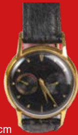
D=3,5 cm LeCoultre Futurmatic Schweiz um 1953, vergoldet