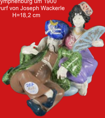
Nymphenburg um 1900 Entwurf von Joseph Wackerle H=18,2 cm