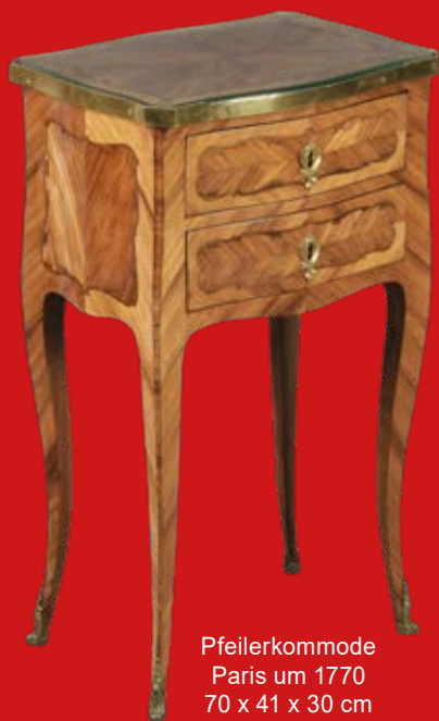
Pfeilerkommode Paris um 1770 70 x 41 x 30 cm