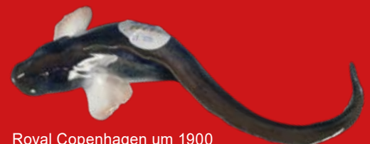
Royal Copenhagen um 1900 Entwurf Carl Liisberg L=20 cm