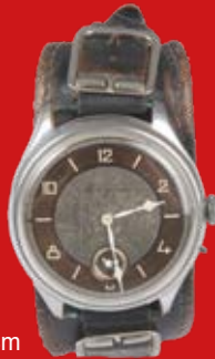
D=4,6 cm Longines Schweiz um 1903 Messing