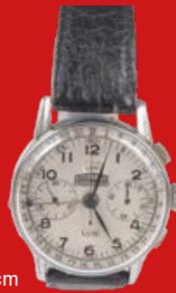
D=3,7 cm Angelus Triple Date Chrono dato Schweiz um 1945 versilbert