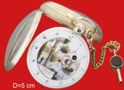
D=5 cm Spindeluhr, Colladon & Fils Genf um 1800 vergoldet