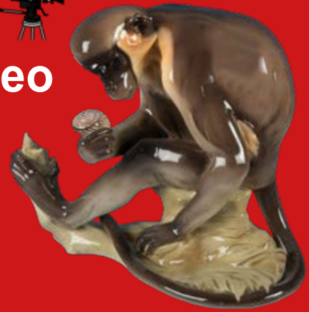
Nymphenburg 1913 Entwurf von Theodor Kärner H=23,8 cm