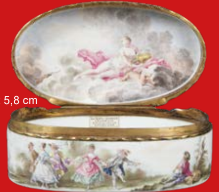
4,3 x 10,4 x 5,8 cm