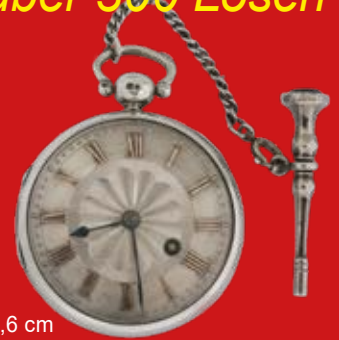
D=4,6 cm Spindeluhr London 1831, Silber