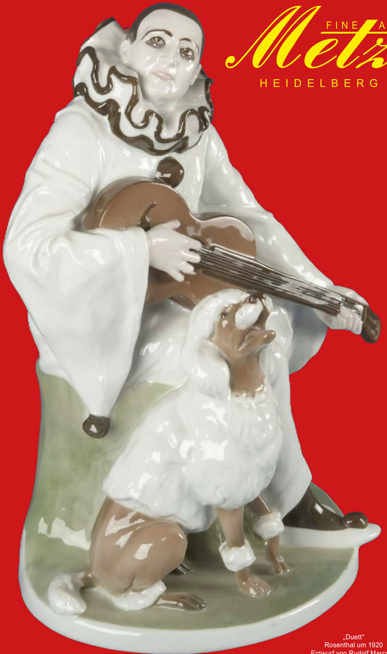
„Duett“ Rosenthal um 1920 Entwurf von Rudolf Marcuse H=34,9 cm