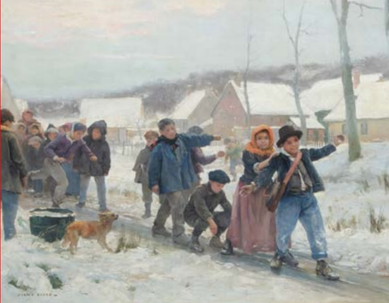
Julien Dupré (1851-1910), Öl/Lw., li./u./sign., gerahmt, 65 x 81 cm