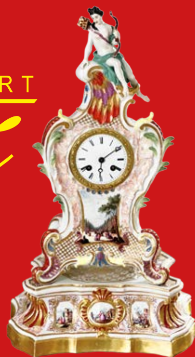
Tischuhr auf Sockel, Meissen 1730-35 Modell von Johann Joachim Kaendler H=50 cm

Katalog abrufbar ab 4. Juli 2026 metz-auktion.de