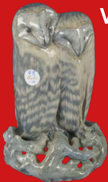
Royal Copenhagen um 1900 Entwurf von Arnold Krog H=32,3 cm