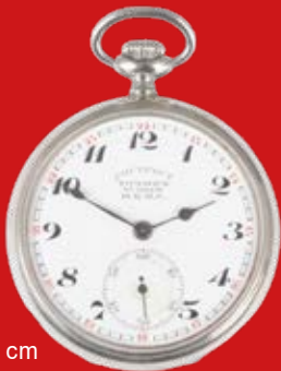
D=5,0 cm Eisenbahner-Taschenuhr Gostrest Totschmech Sowjetunion um 1930, Metall