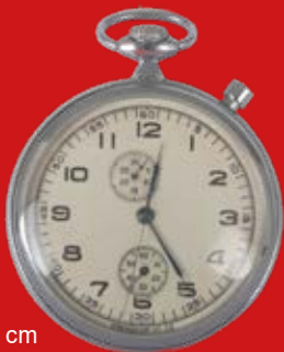
D=5,0 cm Dienstuhr für russische Offiziere UdSSR 1955 Moskauer Uhrenfabrik Metall