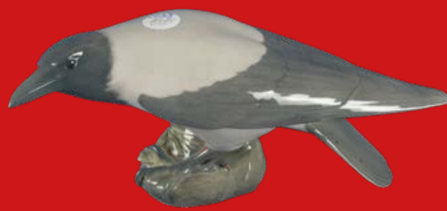
Royal Copenhagen um 1900 Entwurf von Christian Thomsen H=15,3 cm