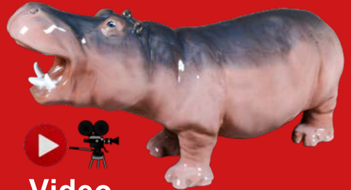
Royal Copenhagen um 1900 Entwurf von Prinzessin Marie von Dänemark H=17,9 cm