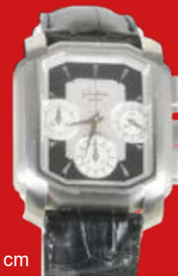
D=3,8 cm „Senator Karrée“ Glashütte 1999 Edelstahl