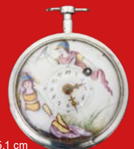
D=5,1 cm Spindeluhr Girardier L'aîné Genf um 1800, Silber