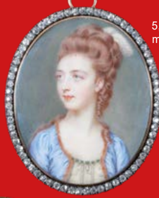
4,7 x 4 / 5,4 x 4,5 cm mit Rahmen