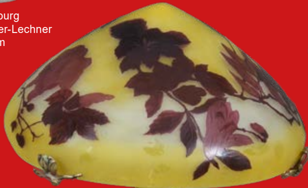
Jugendstil-Tischlampe Nancy, Émile Gallé um 1900 H=71 cm, D=41,5 cm