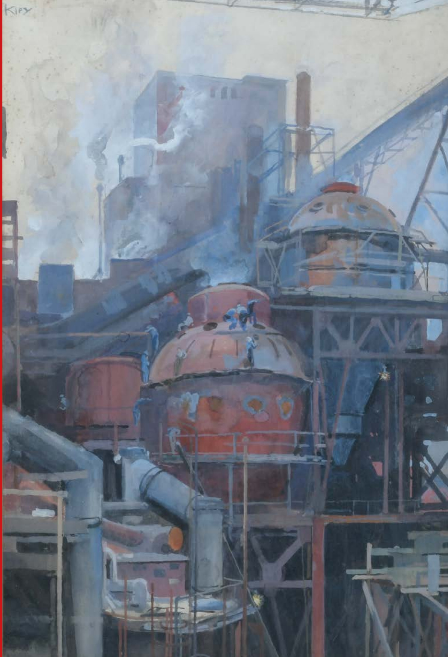
Heinrich Kley (1863-1945), Mischtechnik, sign., ger., 54 x 37 cm