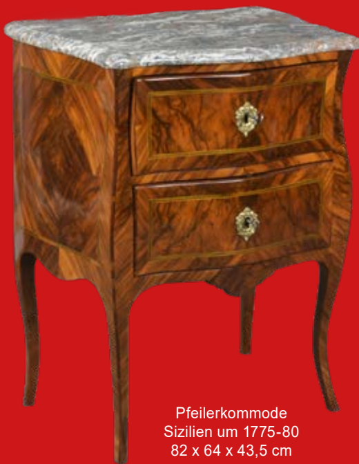
Pfeilerkommode Sizilien um 1775-80 82 x 64 x 43,5 cm