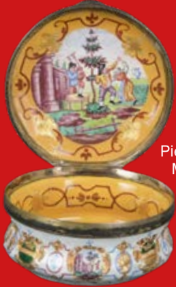
Email-Tabatière Pierre Fromery, Berlin 1730 Malerei von C. F. Herold 3,5 x 6,7 cm