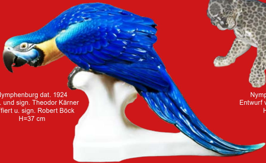
Nymphenburg dat. 1924 Entw. und sign. Theodor Kärner staffiert u. sign. Robert Böck H=37 cm