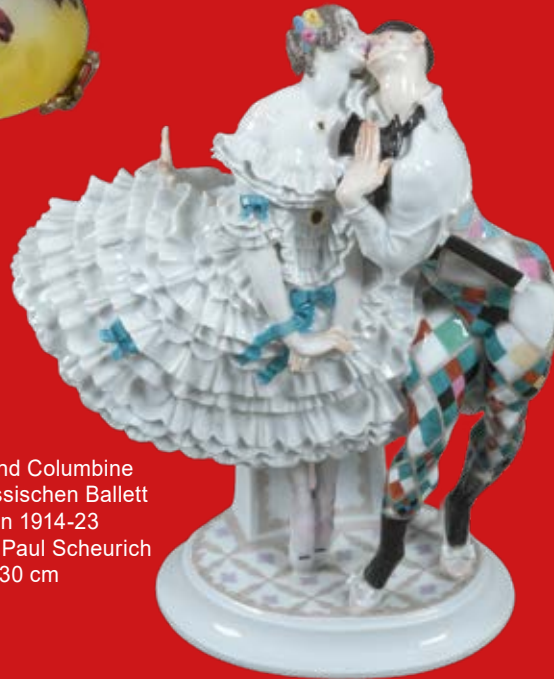
Harlekin und Columbine aus dem russischen Ballett Meissen 1914-23 Entwurf von Paul Scheurich H=30 cm