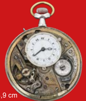
D=4,9 cm Taschenuhr für den türkischen Markt Schweiz um 1900 Silber