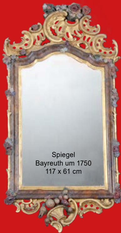
Spiegel Bayreuth um 1750 117 x 61 cm