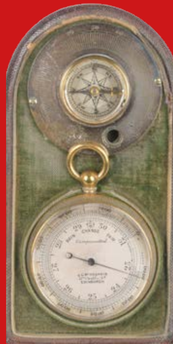
Kompass und Taschenbarometer England um 1920, Messing 12,3 x 6,5 x 3,2 cm