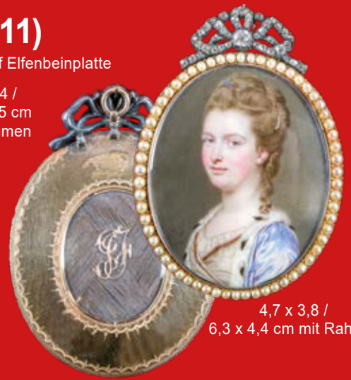
4,7 x 3,8 / 6,3 x 4,4 cm mit Rahmen