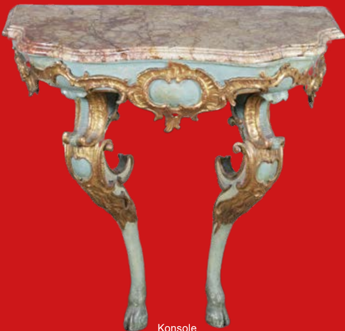
Konsole Franken 1745-50 82 x 80 x 44 cm