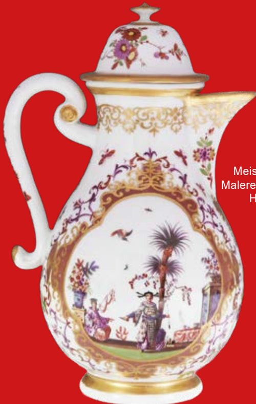
Kanne Meissen 1723-24 Malerei J. G. Hoeroldt H=20,5 cm