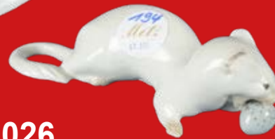
Heubach 20. Jh. Entwurf von Paul Zeiller H=4,9 cm

Katalog abrufbar ab 4. Juli 2026 metz-auktion.de