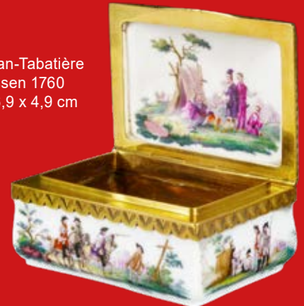
Porzellan-Tabatière Meissen 1760 3,6 x 6,9 x 4,9 cm