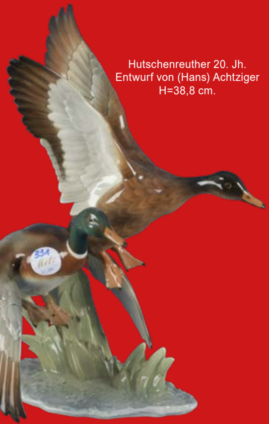
Hutschenreuther 20. Jh. Entwurf von (Hans) Achtziger H=38,8 cm.