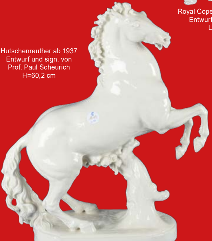
Hutschenreuther ab 1937 Entwurf und sign. von Prof. Paul Scheurich H=60,2 cm