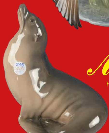
Royal Copenhagen um 1900 Entwurf von Theodor Madsen H=27,7 cm