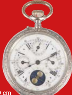
D=5,0 cm Taschenuhr mit Vollkalendarium und Mondphase Schweiz um 1900, Silber