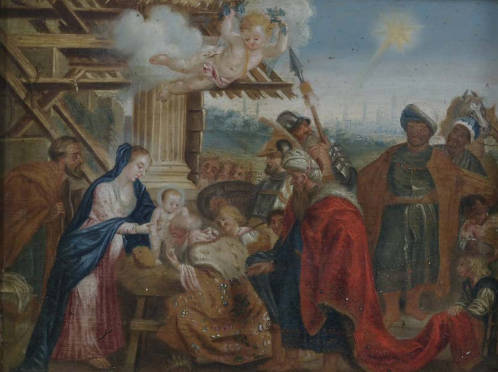
Flämischer Meister des 17. Jhs, Öl/Holz, ger., 20 x 25,5 cm