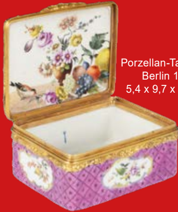
Porzellan-Tabatière Berlin 1775 5,4 x 9,7 x 7,7 cm