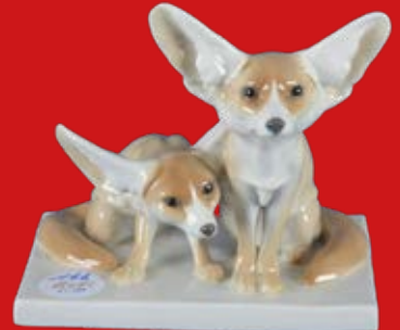
Meissen 1924-34 Entwurf von Otto Pilz H=14,9 cm