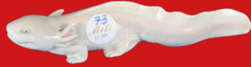
Royal Copenhagen um 1900 Entwurf Carl Liisberg L=24 cm