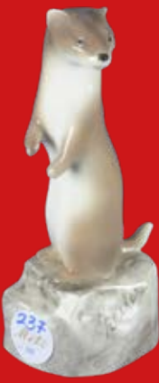
Goldscheider Wien Entwurf von Paul Zeiler H=16,9 cm