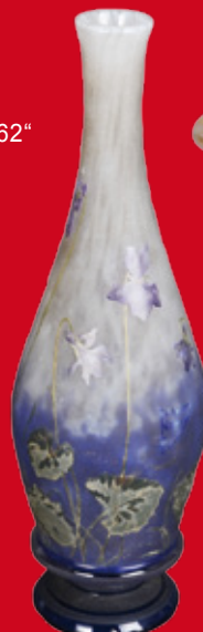
Jugendstil-Vase Daum Frères um 1900