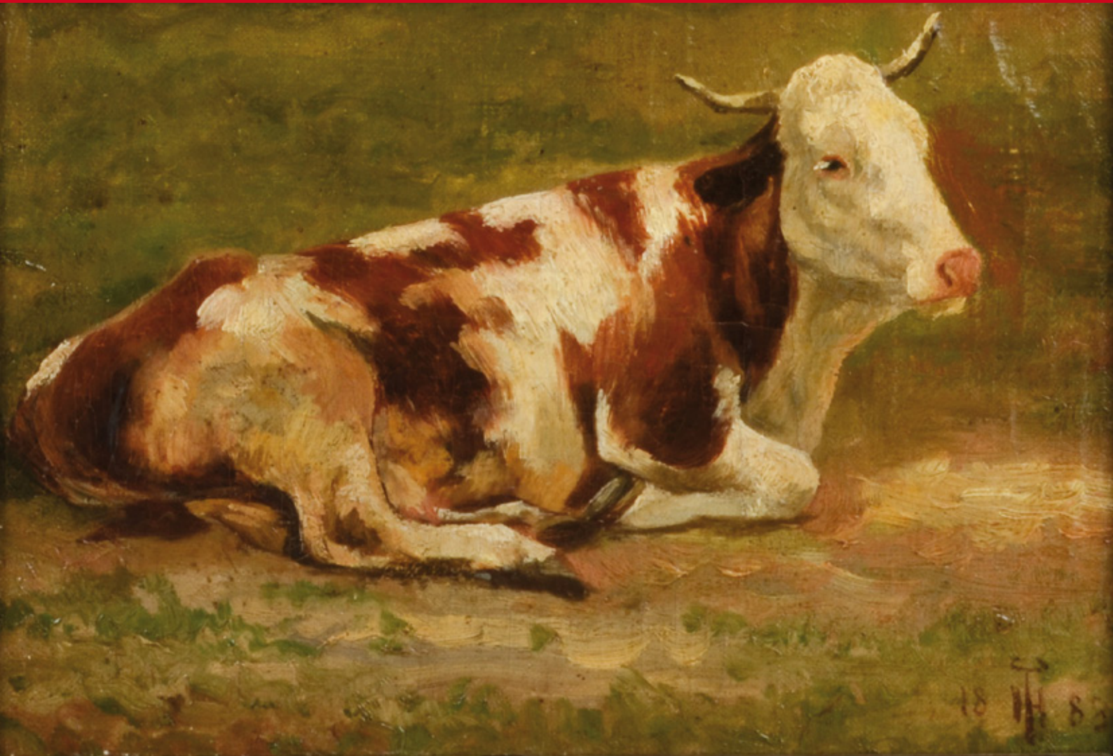
Hans Thoma (1839-1924) Ruhende Kuh in Landschaft Öl/Lw., re./u./monogr./dat. 1888 18,5 x 26,5 cm

Besichtigung: Montag, 15., bis Donnerstag, 18. Juli, 10:00-18:30