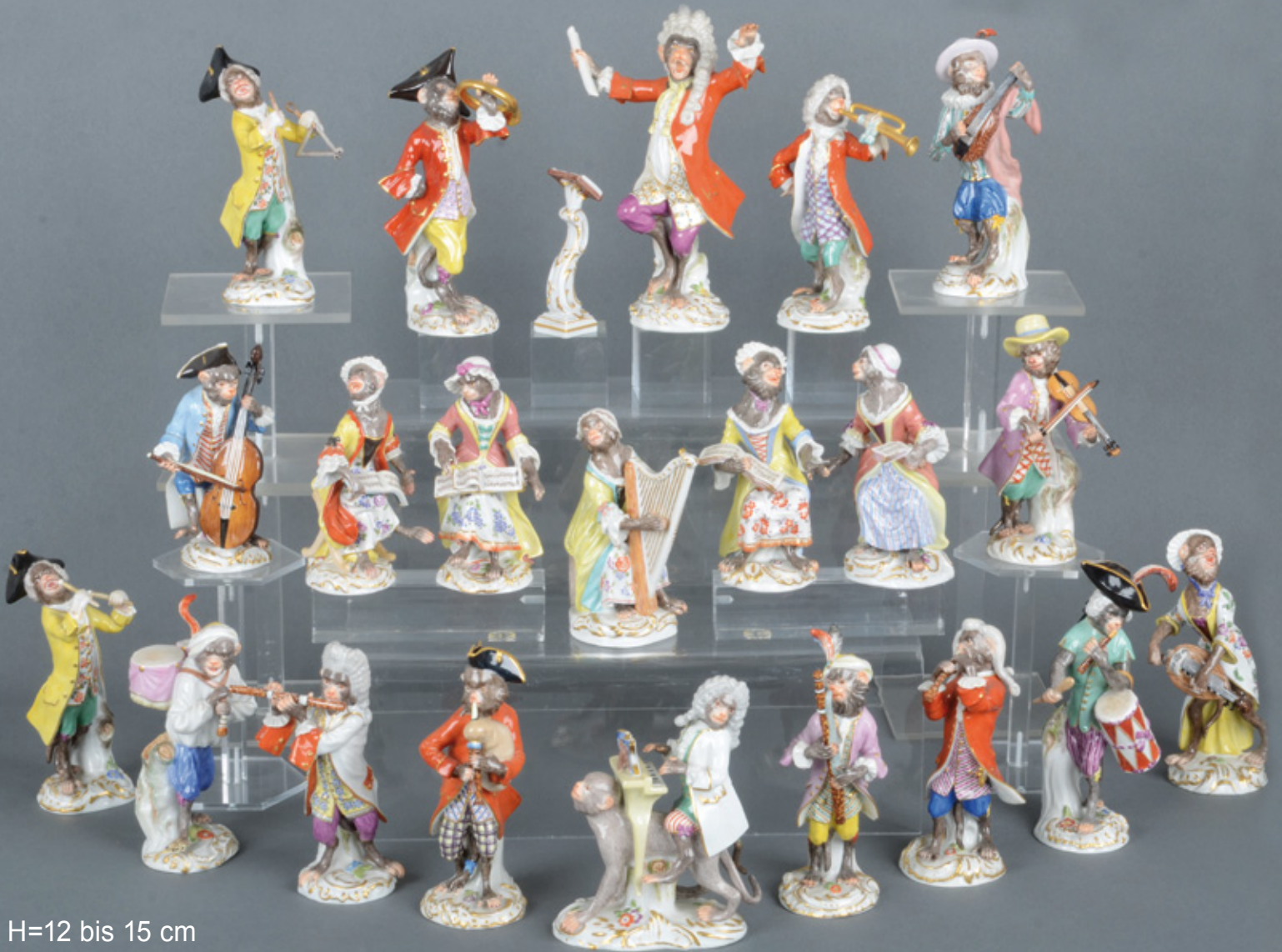
21-teilige komplette Affenkapelle, Meissen 20. Jh., Modelle nach Johann Joachim Kaendler