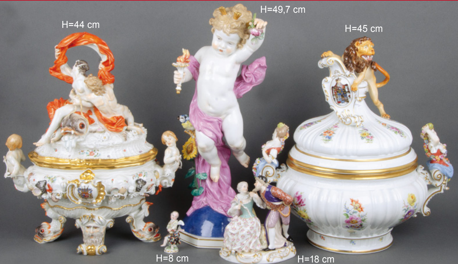
Aus unserem Meissen-Angebot des 19./20. Jhs.