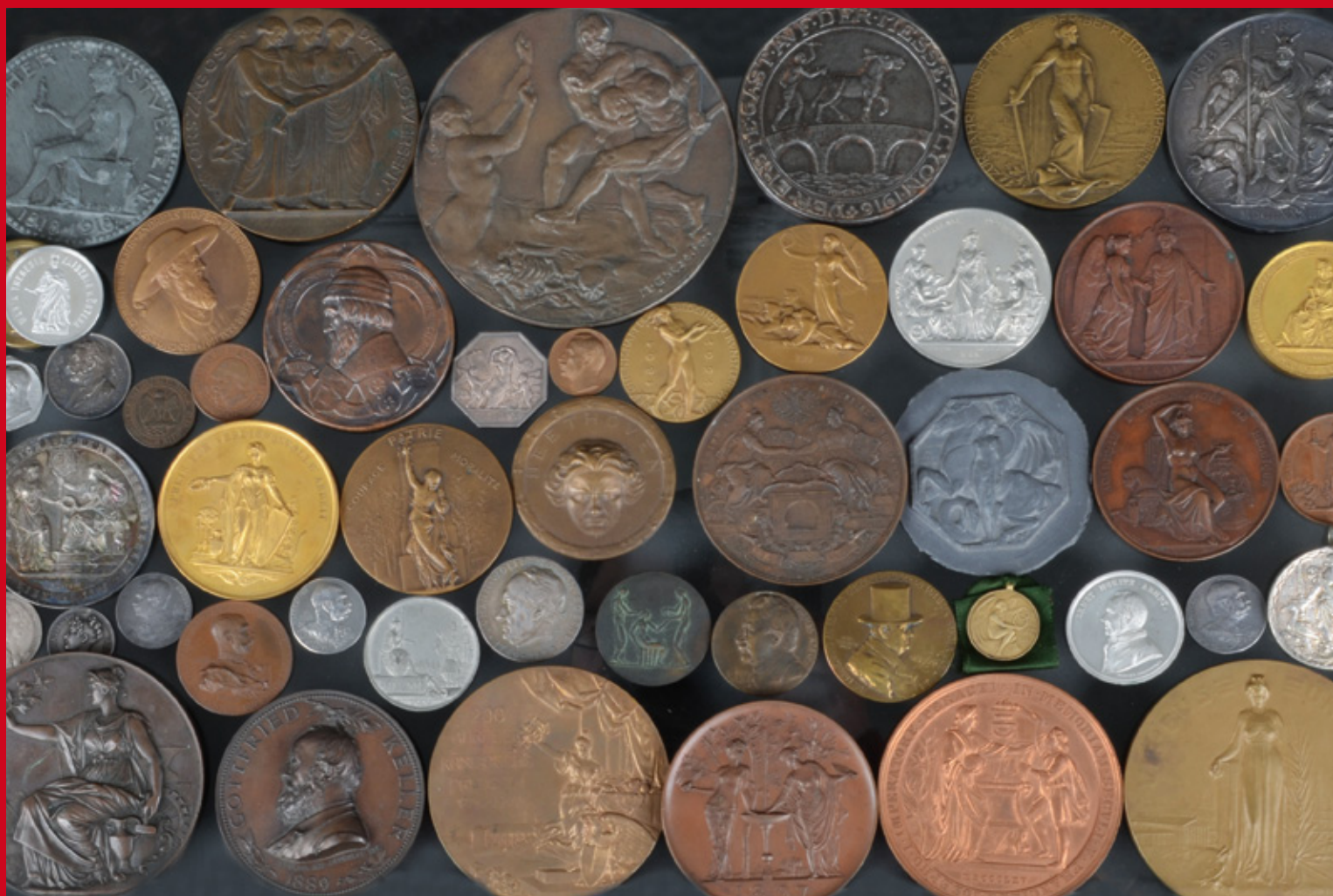
Sammlung von insgesamt 208 Medaillen aus dem 18. bis 20. Jahrhundert, D=2,3 bis 11 cm