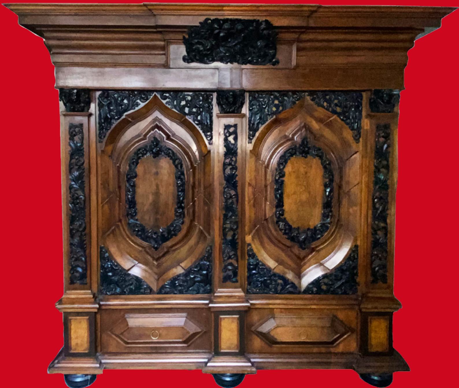
Bedeutender Schapp Hamburg um 1700

Besichtigung: Montag, 15., bis Donnerstag, 18. Juli, 10:00-18:30