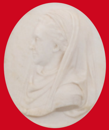
...und Elisabeth Jung-Stilling, eines sign./dat. 1792, gerahmt, 10 x 8 cm, bzw. mit Rahmen, 17 x 15 cm