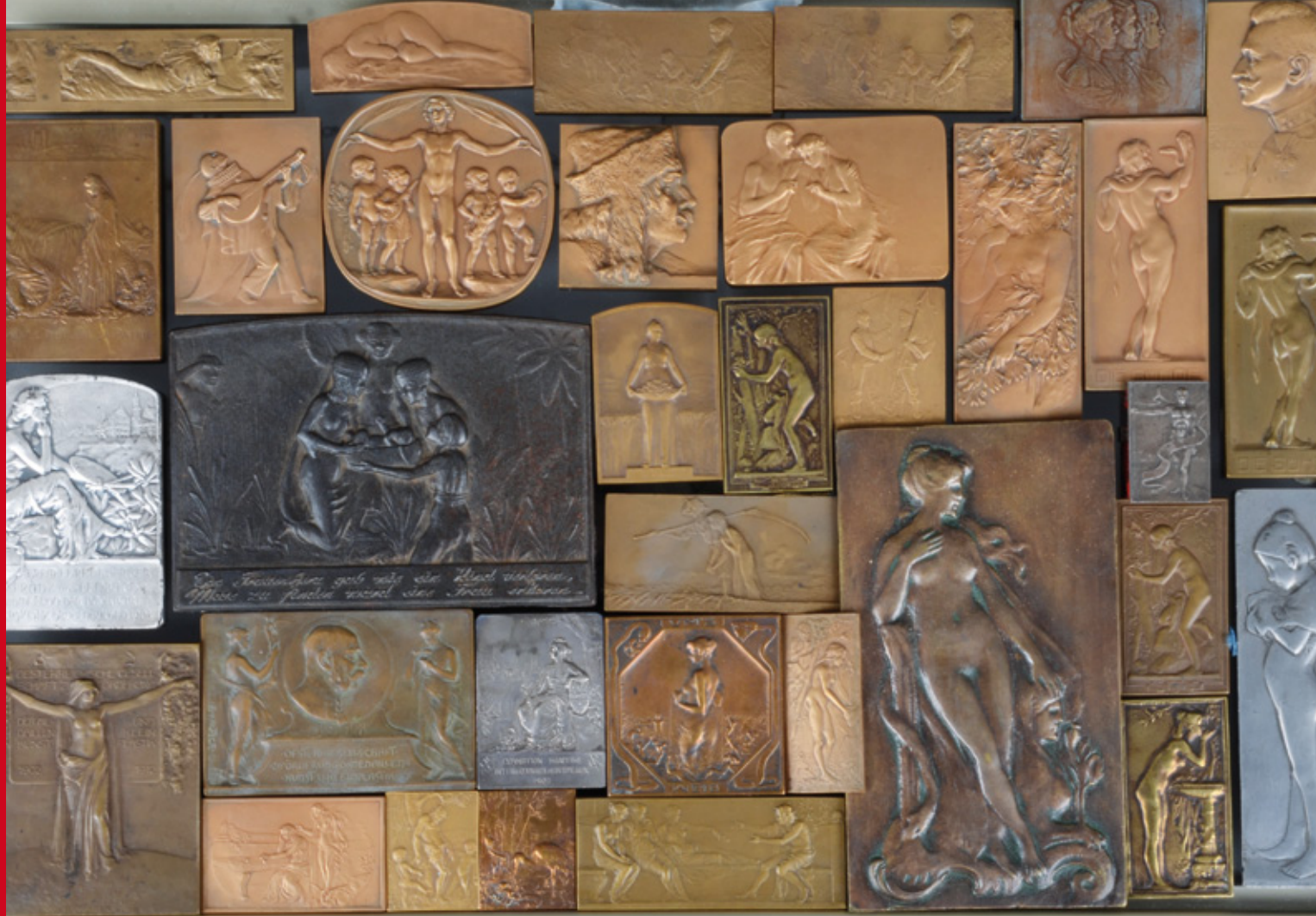
Sammlung von insgesamt 81 Plaketten aus dem 18. bis 20. Jahrhundert, 4 x 3 bis 19 x 19 cm