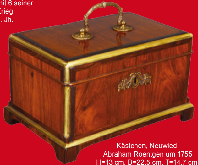
Kästchen, Neuwied Abraham Roentgen um 1755 H=13 cm, B=22,5 cm, T=14,7 cm