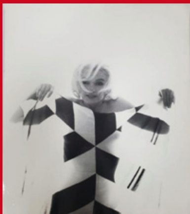
Bert Stern (1929-2013) „Marilyn Monroe in striped scarf - The last sitting, 1962“ 2 Silbergelatineabzüge je 50,5 x 40,4 cm