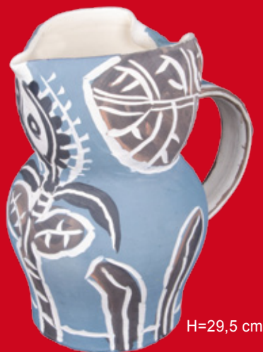
Pablo Picasso (1881-1973) „Gothique aux feuilles“ (A.R. 178) Madoura Plein Feu, 87/100