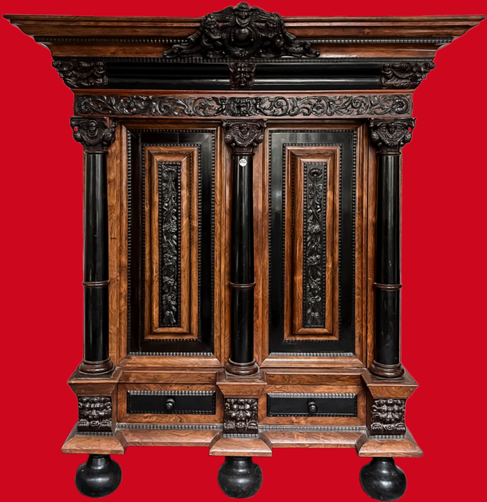
Barock-Kissenschrank Amsterdam 1770

Eichenkorpus, Palisander furniert, teilw. aufwändig geschnitzt und ebonisiert H=205 cm, B=185 cm, T=90 cm