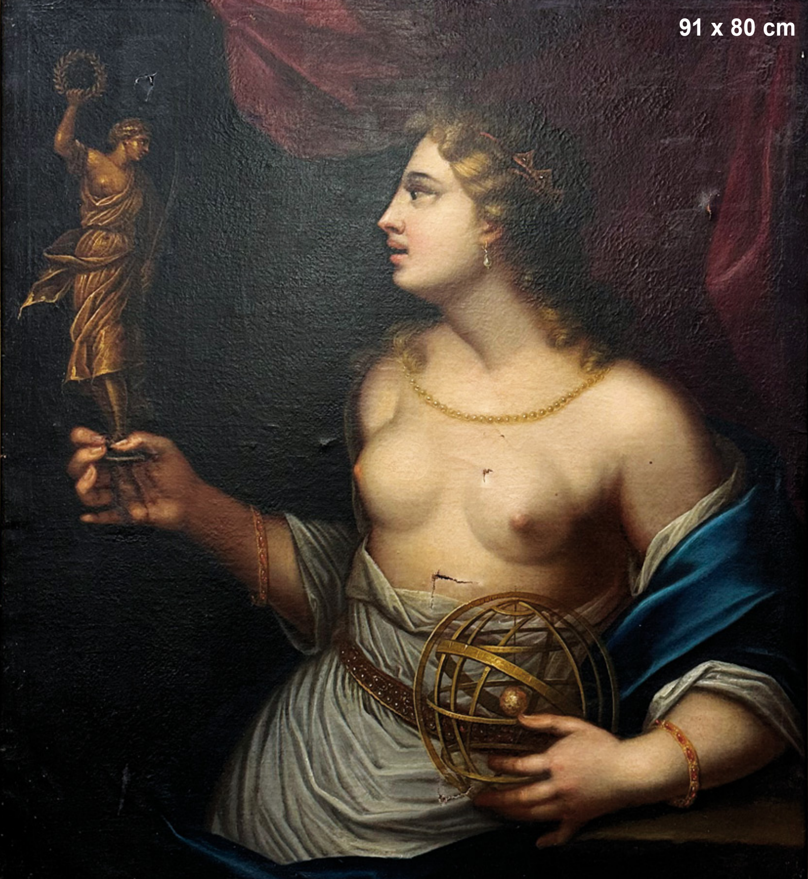
Italienischer Meister des 17./18. Jhs. Muse „Urania“ Öl/Leinwand, gerahmt