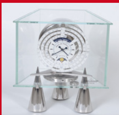
Jaeger LeCoultre Atmos du Millénaire Atlantis 28 x 25 x 15 cm