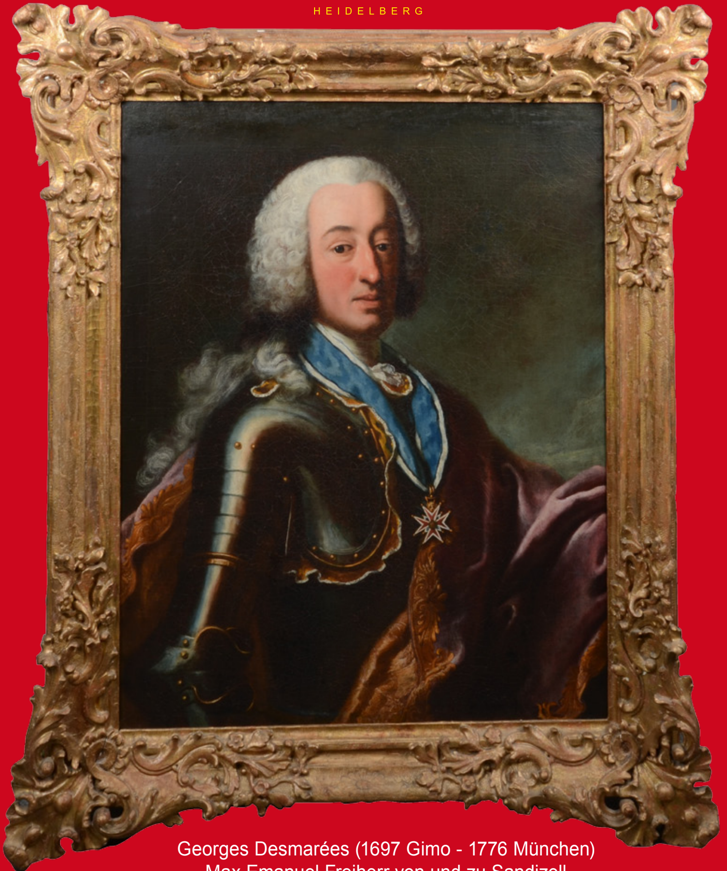
Georges Desmarées (1697 Gimo - 1776 München) Max Emanuel Freiherr von und zu Sandizell Hüftbild im Kürass mit Kreuz des Hausritterordens vom Hl. Georg Öl/Lw., gerahmt Rückseitig auf Leinwand in Tinte alt beschriftet und dat. 1745 Originaler vergoldeter Effner-Rahmen 87 x 68 cm