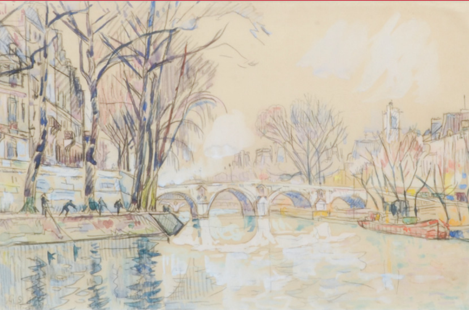
Paul Signac (1863-1935) Angler am Ufer der Seine, Aquarell, li. unten monogr., hi. Glas gerahmt 27 x 43 cm

Besichtigung: Montag, 15., bis Donnerstag, 18. Juli, 10:00-18:30