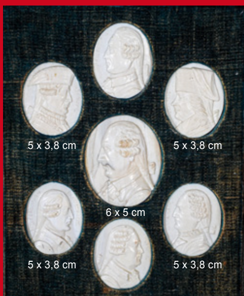
7 Porträtreliefs: Friedrich der Große mit seiner Generäle aus dem 7-jährigen Krieg Elfenbein, geschnitzt, Berlin 18. Jh.