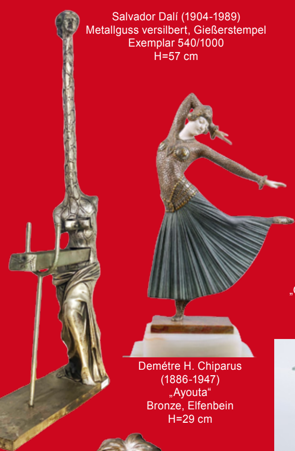
Salvador Dalí (1904-1989) Metallguss versilbert, Gießerstempel Exemplar 540/1000 H=57 cm