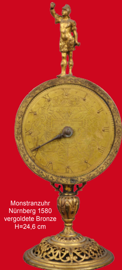
Monstranzuhr Nürnberg 1580 vergoldete Bronze H=24,6 cm