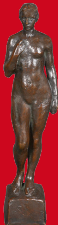
Wilhelm Lehmbruck (1881-1919) Bronze, brüniert, seittl. sign./dat. 1908 H=37,6 cm