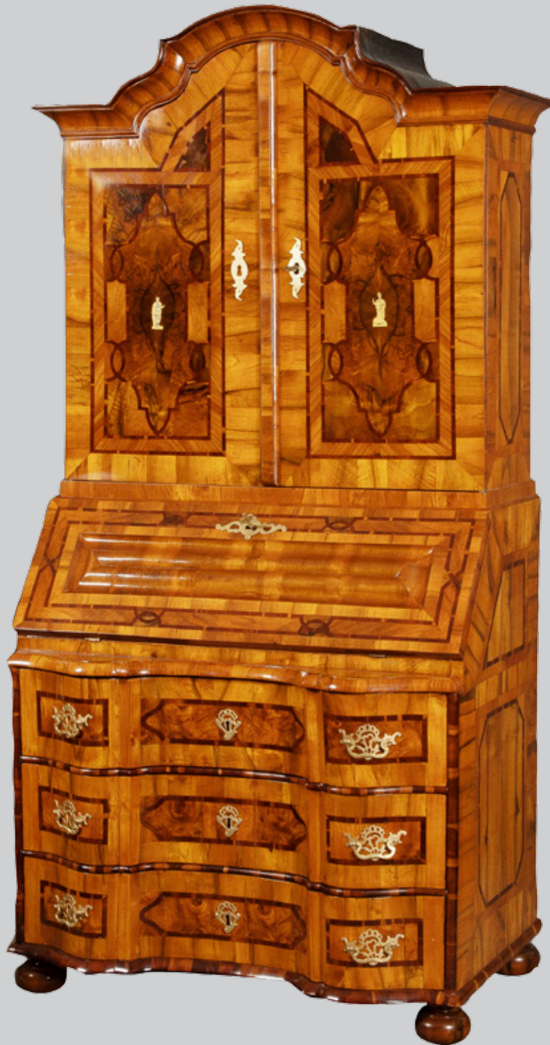
Barock-Aufsatzsekretär, Braunschweig um 1750 Nussbaum- und Pflaumenholz furnier, teilweise massiv, mit Beineinlagen H=208 cm, B=100 cm, T=66 cm