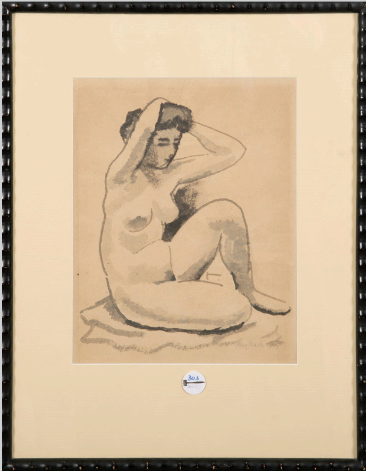
August Macke (1887-1914) attrib. Sitzender Frauenakt. Tusche, laviert, re./u./sign., dat. 1912, hi./Gl./gerahmt, 37,5 x 29,5 cm