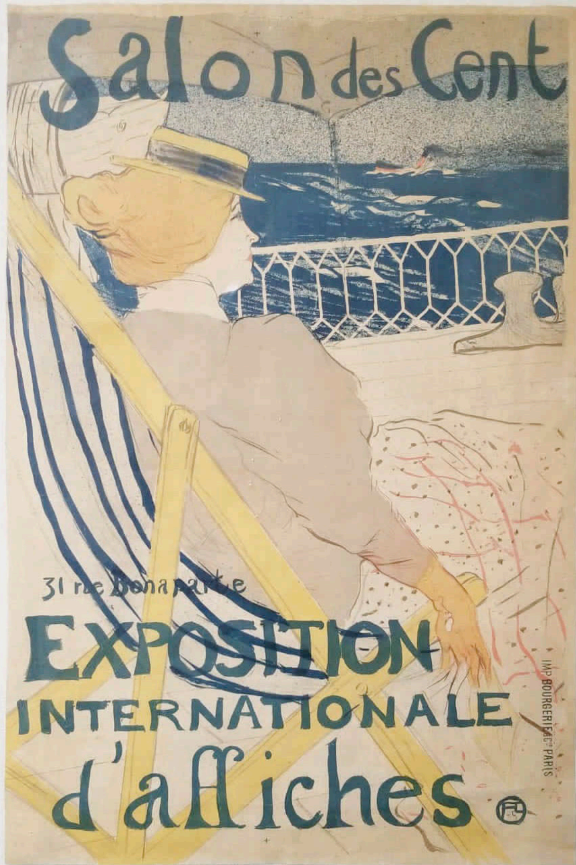
Henri de Toulouse-Lautrec (1864-1901). „Salon des Cent: Exposition Internationale d'affiches (1895)“. Druckgra- phik, 60 x 40 cm.