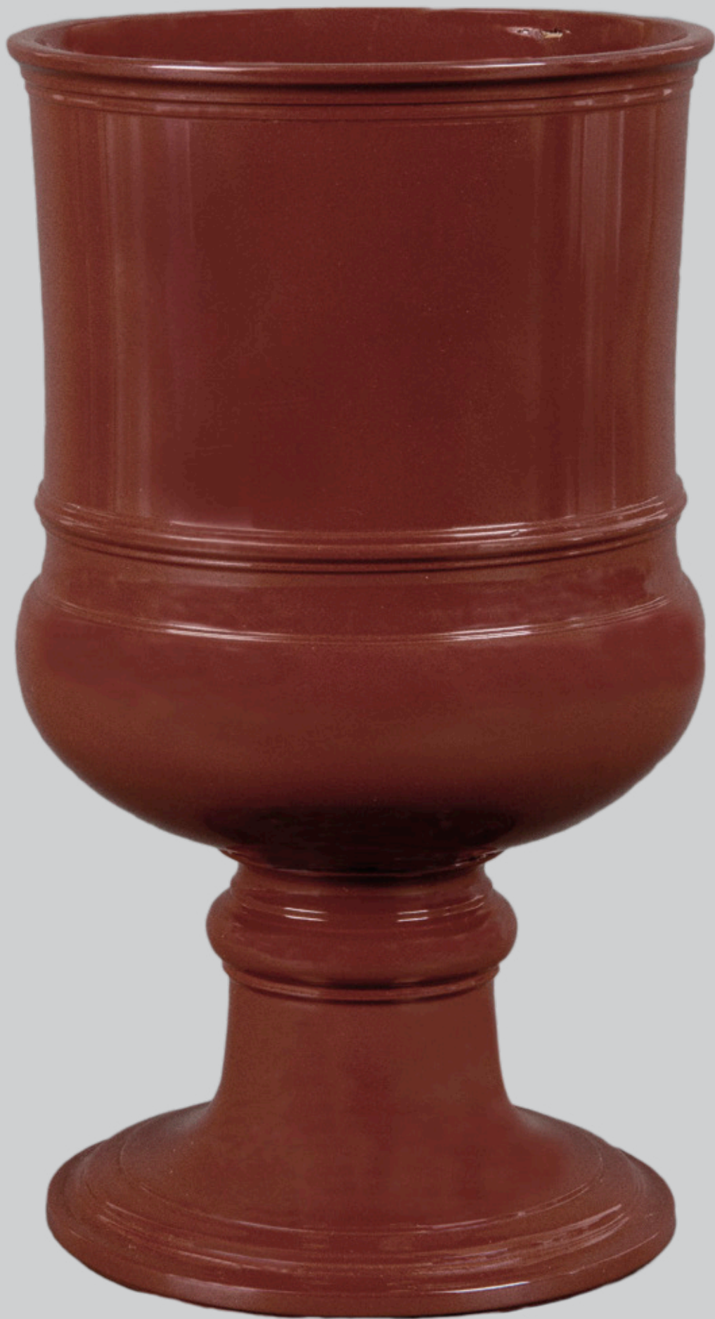
Böttgersteinzeug-Pokal, Meissen 1710 Modell von Johann Jacob Irminger