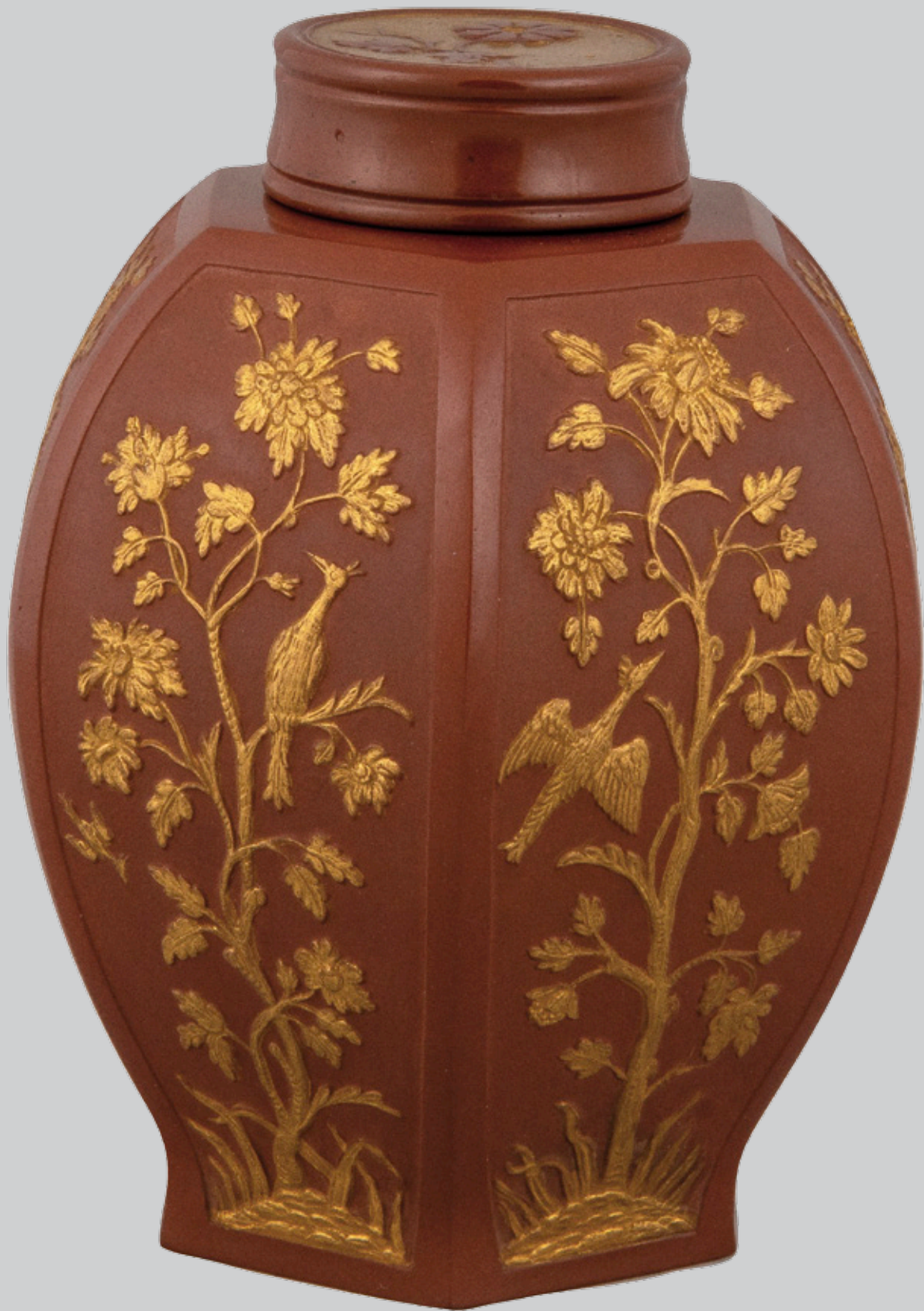
Böttgersteinzeug-Teedose, Meissen 1710-12 Modell von Johann Jacob Irminger