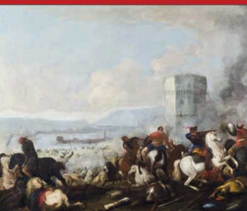
Jacques Courtois (1621-1676) zugeschrieben, Öl/Lw., gerahmt, 75 x 94 cm