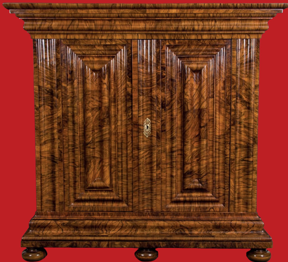
Barock-Wellenschrank, Frankfurt um 1710, Nussbaumwurzels querfurniert, H=205 cm, B=200 cm, T=80 cm