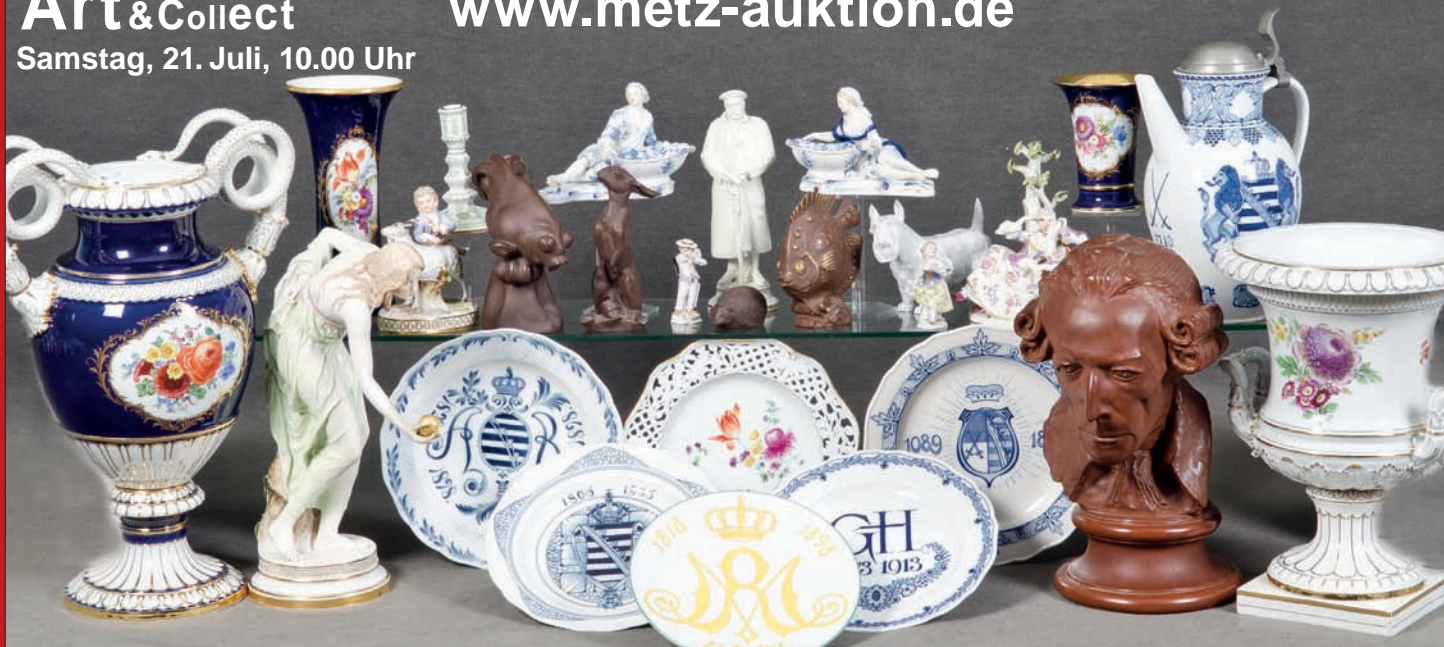
Sammlung von Meissen Porzellan des 19.-20. Jhs., Modelle u.a. von E.A. Leuteritz, E. Oehme, W. Schott, nach J.J. Kaendler, H=4 cm bis 48 cm