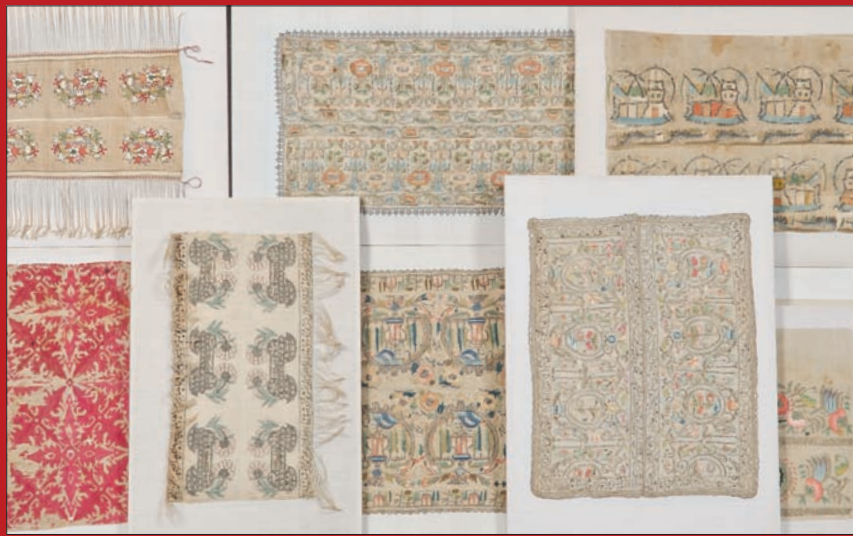
Stoffsammlung des 16.-20. Jhs., ca. 40 Stück 19,6 x 34 cm bis 28 x 129 cm