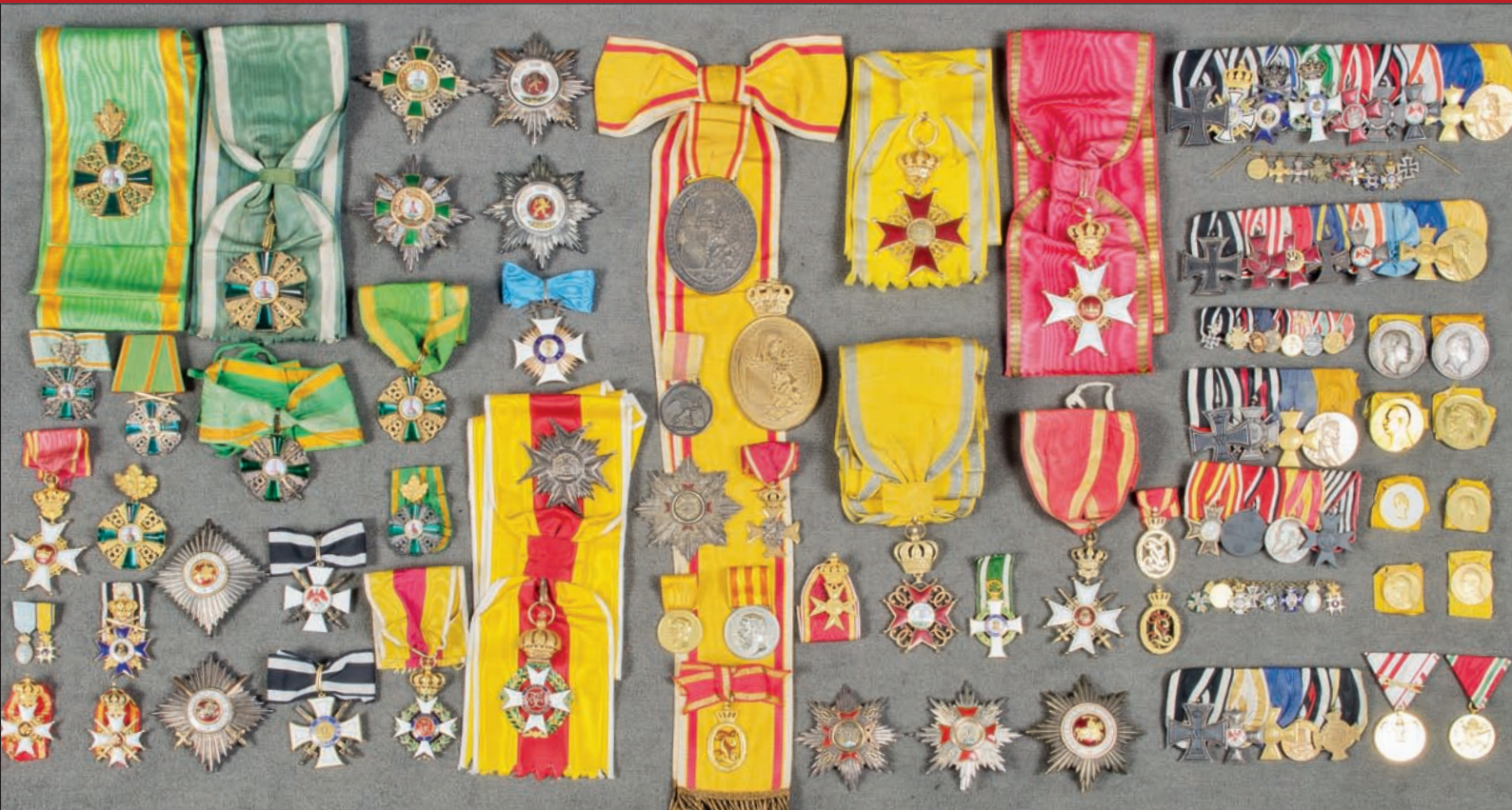
Sammlung von Orden und Ehrenzeichen des 19.-20. Jhs., u. a. Zähringer Löwen, Badischer Hausorden der Treue, Berthold Ritterkreuz, goldene badische Zivilverdienstmedaillen, badische Fahnenmedaille, bayerischer Militärverdienstorden und Karl-Friedrich-Verdienstorden

Bitte beachten Sie die neuen Vorbesichtsungszeiten