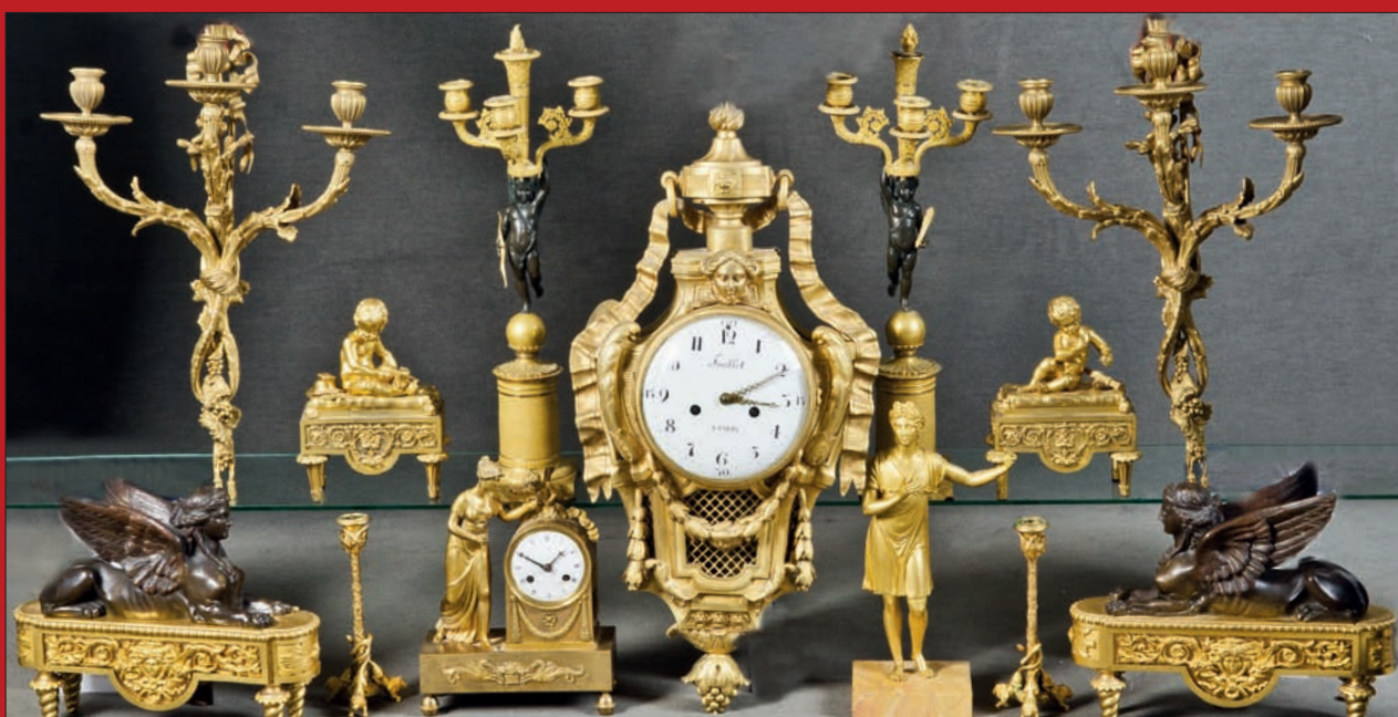
Slg. von feuervergoldeten Bronzen: Wand- und Tischgirandolen, Wand- und Tischuhren, Kaminböcke und Figuren, Paris 18.-19. Jh., H=24 cm bis 73 cm

Vorbesichtigung: Mittwoch, 18., und Donnerstag, 19. Juli 2018, 10.00-20.00 Uhr