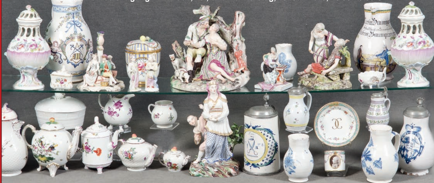
Sammlung von Ludwigsburg Porzellan und Fayence des 18.-19. Jhs., Modelle u.a. von J. C. Beyer, J. C. Hasselmeyer, J. A. Weinmüller, H=4,5 cm bis 28 cm

Vorbesichtigung: Mittwoch, 18., und Donnerstag, 19. Juli 2018, 10.00-20.00 Uhr