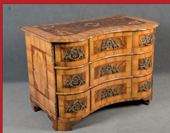
Barock-Kommode, Dresden um 1740-50, H=81,5 cm, B=117,5 cm, T=64 cm