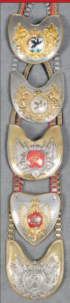
Slg. von 5 Ringkragen Preußen 19. Jh.