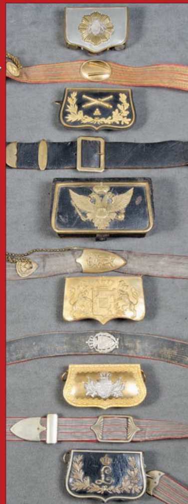
Slg. von ca. 20 Kartuschenkästen Bayern, Preußen, Sachsen, Waldeck 19. Jh.